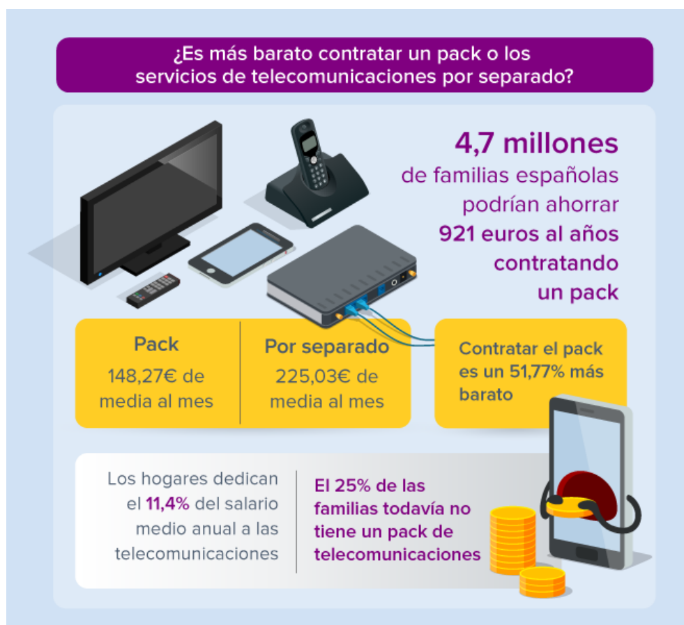
TABLA 1. ¿ES MÁS BARATO CONTRATAR UN PACK O LOS SERVICIOS DE TELECOMUNICACIONES POR SEPARADO?

Teniendo en cuenta lo que pagan de media tanto a las familias que disponen de pack como las que no cuentan con una oferta convergente, en cada hogar español se abona, de media, 186,65 euros al mes por todos los servicios de Internet y telefonía, lo que supone el 11.40% del salario medio anual 6 registrado en 2017 (1.636 euros).